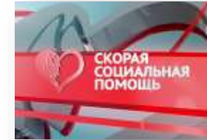
Экстренная социально-правовая, психолого-педагогическая помощь