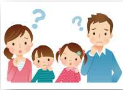
Семья, нуждающаяся в помощи