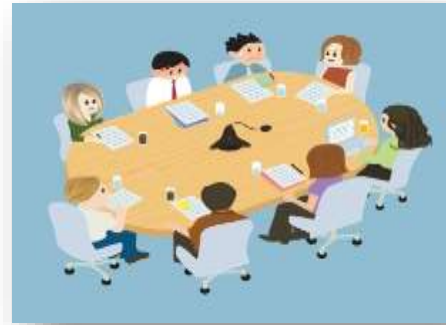
Комплексное решение проблем семьи