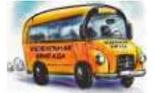
Межведомственная мобильная бригада