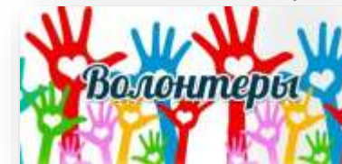
Волонтерство и наставничество