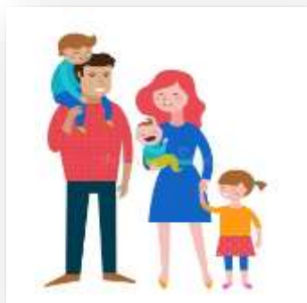
Проблема семьи решена