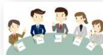
Команда специалистов различных ведомств для решения проблем семьи