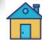
Консультационные пункты в сельских поселениях