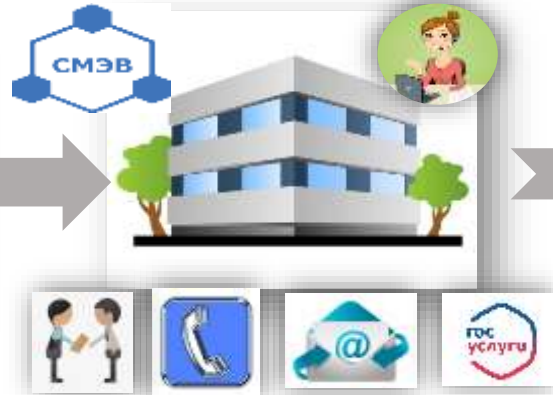
Обращение в единое окно